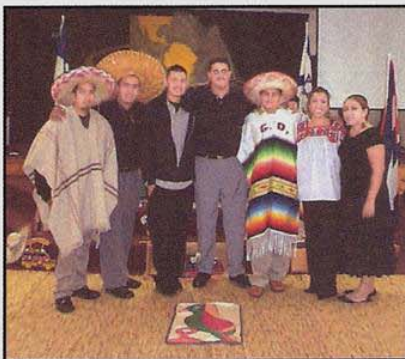
Alumnos del Instituto Bíblico Latinoamericano que estudian América Latina

Para muchos misioneros el visitar las iglesias para recaudar fondos causa confusión de sentimientos. Uno de inmediato piensa en grandes presupuestos que parecen una amenaza